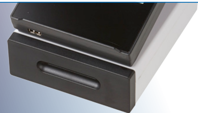
RS 260-Terminal mit der Option motorisches Laufwerk (für Magnet- oder RFID-Karten)