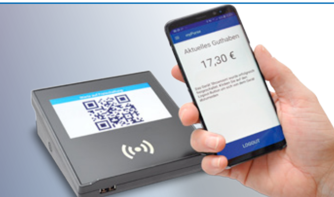
Optional: RS 260-Terminal mit Smartphone-Zahlung via myPurse-App