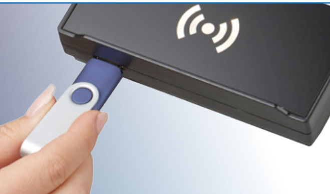
RS 260-Terminal mit optionaler RFID- und USB-Schnittstelle

Die Steuereinheit in modernem Design mit intuitiver Bedienung.